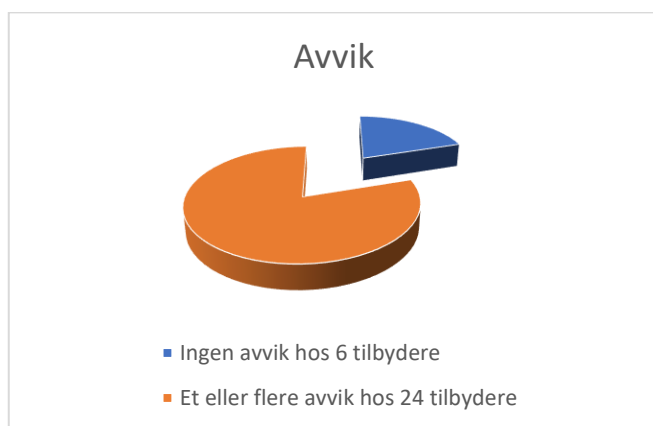
Figur 1: Antall tilbydere med avvik under tilsynet

Det ble funnet et eller flere avvik hos 24 av 30 tilbydere. Hos 10 av disse tilbyderne var avvikene lukket allerede på tilsynstidspunktet. Tilbyderne har deretter fått en frist for å komme med kommentarer til avviket, og redegjøre for eventuell lukking av avvik. For et fåtall avvik som på vedtakstidspunkt ikke er rettet, vil Nkom følge opp med vedtak og eventuelt varsel om tvangsmulkt.